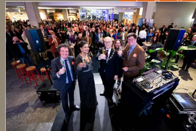
FEEST | Natuurlijk kon een officieel jubileumfeest niet ontbreken. Burgemeester Aboutaleb kwam met ons en vele vrienden en partners het glas heffen op de volgende 150 jaar!