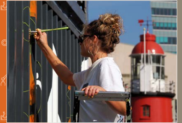
KNRM | De Koninklijke Nederlandse Reddingsmaatschappij (KNRM) viert haar 200-jarig jubileum. Nog een mooi feest! Dat werd gevierd met een tijdelijke tentoonstelling en diverse activiteiten in en om ons museum.