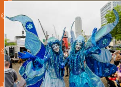
PICKNICK | Wie jarig is trakteert! Bezoekers konden heerlijk eten en drinken en genieten van entertainment tijdens onze jubileumpicknick aan het water.