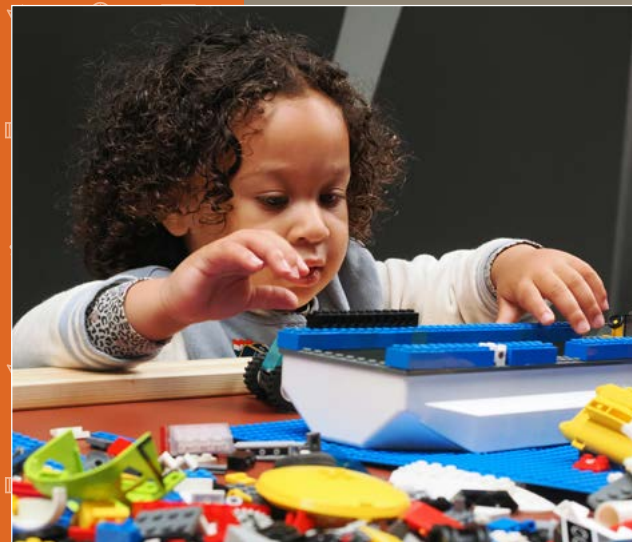
LEGO CHALLENGE | Nog zo'n schot in de roos! Bouwen met Lego is altijd een succes. Aan boord van museumship 'Geertruida' bouwden kinderen oplossingen voor schone oceanen.