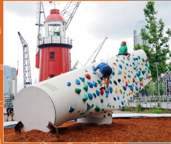
BOLDERWIEK Een gerecyclede windmolenwiek als speeltoestel? Natuurlijk, in onze haven. Kinderen klommen en klauterden op dit verjaardagscadeau.